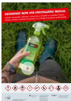
Soggetto giardinaggio Gruppo target: grande pubblico Numero d'ordine UFCL: 311.793.i