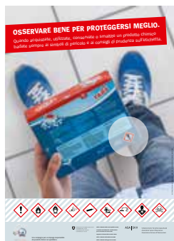
Soggetto economia domestica Gruppo target: grande pubblico Numero d'ordine UFCL: 311.790.i

Per meglio venire incontro alle vostre esigenze di comunicazione, i manifesti sono disponibili in quattro diversi soggetti: potete alternarli per richiamare più attenzione.