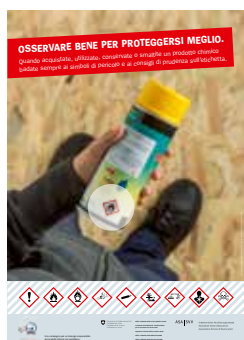
Soggetto passatempo Gruppo target: grande pubblico e professionisti Numero d'ordine UFCL: 311.792.i