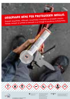
Soggetto utente professionale Gruppo target: professionisti Numero d'ordine UFCL: 311.791.i