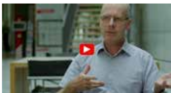
Intervista a Heribert Bürgy, capo della Sezione controllo del mercato e consulenza, UFSP e a Fabrizio Guidotti, Ispettore prodotti chimici del Cantone Ticino

Una serie di filmati propone interviste a responsabili di aziende, organizzazioni e autorità sull'attuazione concreta del GHS. Sono stati realizzati come esempi di «Best Practice» per motivare altre aziende od organizzazioni a tematizzare il nuovo sistema di classificazione per poi adottarlo.