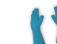
Guantes de protección